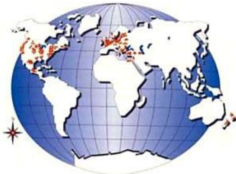
شکل ۱: انتشار بیماری آتشک درختان میوه دانه دار در دنیا

امروزه بیماری آتشک در ۴۶ کشور دنیا گسترش یافته است. در سرتاسر آمریکای شمالی شامل کانادا و مکزیک، انگلستان، هلند، کشورهای شمال غربی اروپا، قبرس، فلسطین اشغالی، ترکیه، یونان، بلغارستان، رومانی و تمام کشورهای استقلال یافته یوگسلاوی سابق و ایران این بیماری وجود دارد (شکل ۱).