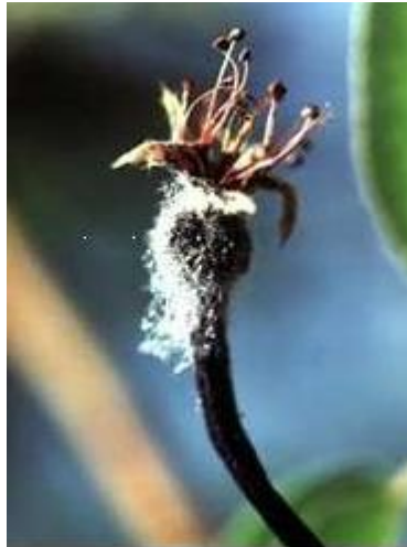
شکل ۴: سیاه شدن دمگل در اثر پیشرفت بیماری

پس از آلودگی شکوفه ها، میوه های جوان نیز با گسترش داخلی بیماری آلوده می شوند. علائم پیشرفته روی میوه های آلوده گلابی به رنگ سیاه ولی روی درختان سیب به رنگ قهوه ای است که به حالت مومیایی تا مدت های مدیدی روی درختان آلوده باقی می ماند (شکل ۵).