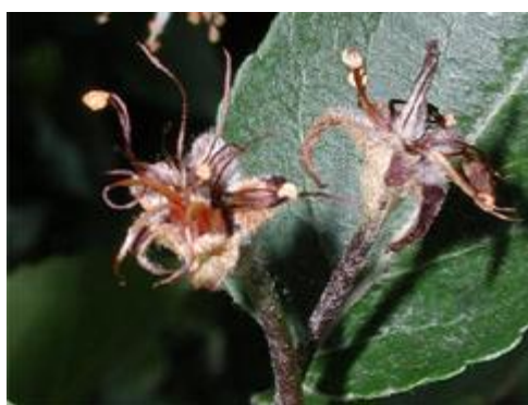
شکل ۳: در اوایل بهار لکه های آبسوخته روی گلبرگ ها تولید می شود و در فاصله کوتاهی مجموعه گل قهوه ای و سپس سیاه می شود.

حساس ترین اندام گیاهی درختان دانه دار نسبت به این بیماری گل ها هستند. این بیماری دارای ۵ فاز یا ۵ مرحله مهم آلودگی بنام های بلایت شکوفه، بلایت سرشاخه و برگ، بلایت میوه، بلایت شاخه های اصلی و تنه و بلایت ریشه (طوقه) می باشد. مهم ترین فاز بیماری بلایت شکوفه است، زیرا گل ها منافذ طبیعی ورود باکتری به اندام های گیاهی و توسعه بیماری می باشند. لذا معمولاً اولین علائمی که در فصل بهار ظاهر می گردد سوختگی شکوفه هاست. شکوفه ها ابتدا حالت آبسوخته پیدا می کنند و سپس پژمرده و چروکیده شده و به رنگ قهوه ای تا سیاه در می آیند. شکوفه های آلوده ممکن است که ریزش کنند ولی معمولاً متصل به شاخه های آلوده باقی می مانند (شکل ۳).