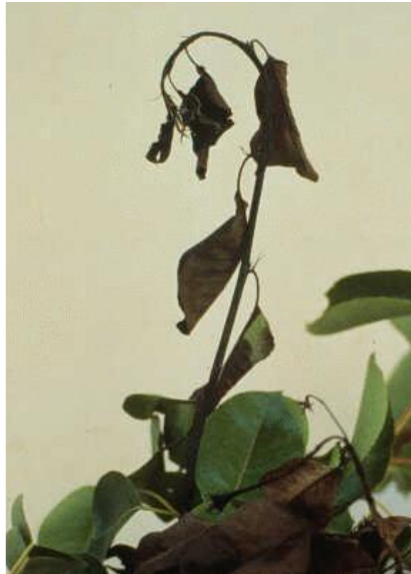
شکل ۷: عصایی شدن سرشاخه گل‌ابی

با پیشرفت بیماری سرشاخه‌ها دچار بلایت می‌شوند که علائم بلایت سرشاخه و برگ‌ها در گل‌ابی عمدتاً به رنگ قهوه‌ای تیره تا سیاه و در سیب‌به رنگ قهوه‌ای روشن تا تیره در می‌آیند. در صورتی که شرایط آب و هوایی مناسب برای توسعه بیماری باشد انتهای شاخه خم شده و شبیه به عصا به نظر می‌رسد که به این حالت سرعصایی شاخه می‌گویند (شکل ۷).