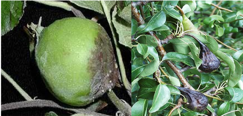
شکل ۵: آلودگی میوه سیب (سمت راست) و گلابی (سمت چپ) به باکتری عامل بیماری آتشک

پس از آلودگی شکوفه ها، میوه های جوان نیز با گسترش داخلی بیماری آلوده می شوند. علائم پیشرفته روی میوه های آلوده گلابی به رنگ سیاه ولی روی درختان سیب به رنگ قهوه ای است که به حالت مومیایی تا مدت های مدیدی روی درختان آلوده باقی می ماند (شکل ۵).