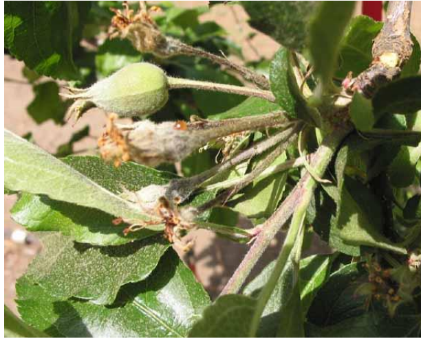
شکل ۶: ترشحات باکتری عامل آتشک روی دمگل

با پیشرفت بیماری سرشاخه‌ها دچار بلایت می‌شوند که علائم بلایت سرشاخه و برگ‌ها در گل‌ابی عمدتاً به رنگ قهوه‌ای تیره تا سیاه و در سیب‌به رنگ قهوه‌ای روشن تا تیره در می‌آیند. در صورتی که شرایط آب و هوایی مناسب برای توسعه بیماری باشد انتهای شاخه خم شده و شبیه به عصا به نظر می‌رسد که به این حالت سرعصایی شاخه می‌گویند (شکل ۷).