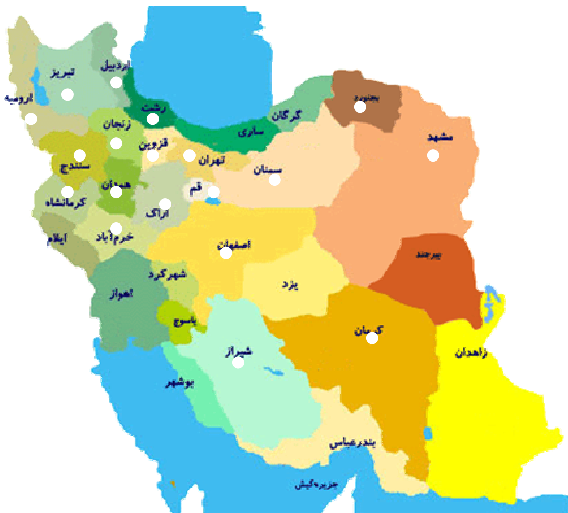
شکل ۲: انتشار بیماری آتشک درختان میوه دانه دار در ایران

نهالستان های مهم کشور در استان تهران آلوده شدند. در حال حاضر این بیماری در استان های آذربایجان شرقی، آذربایجان غربی، اردبیل، تهران، خراسان شمالی، خراسان رضوی، زنجان، سمنان، فارس، قزوین، قم، کردستان، لرستان، مرکزی، گیلان، کرمانشاه، همدان و مناطقی از استانهای اصفهان و کرمان نیز مشاهده شده و وجود آن به اثبات رسیده است (شکل ۲).