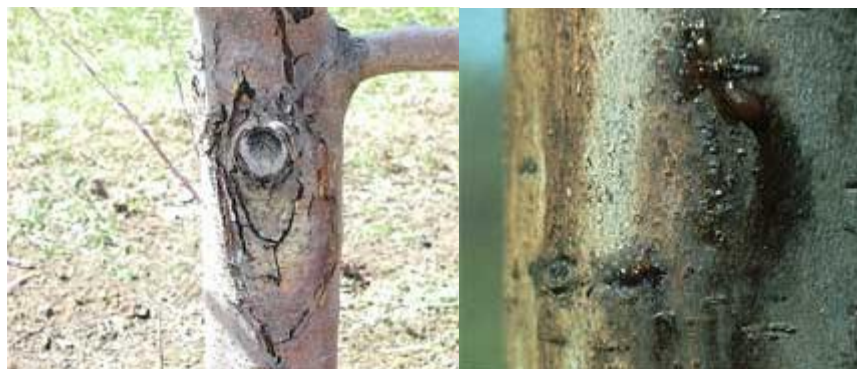
شکل ۸: تراوشات باکتری عامل آتشک بر روی پوست درخت

می شود. البته سوختگی پایه و طوقه مخرب ترین اثر را بر درخت داشته و اغلب باعث مرگ درختان می شود (شکل ۸).